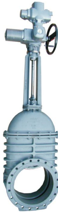
Na zdjęciu DN500

Задвижка клиновая с выдвигным шпинделем под привод