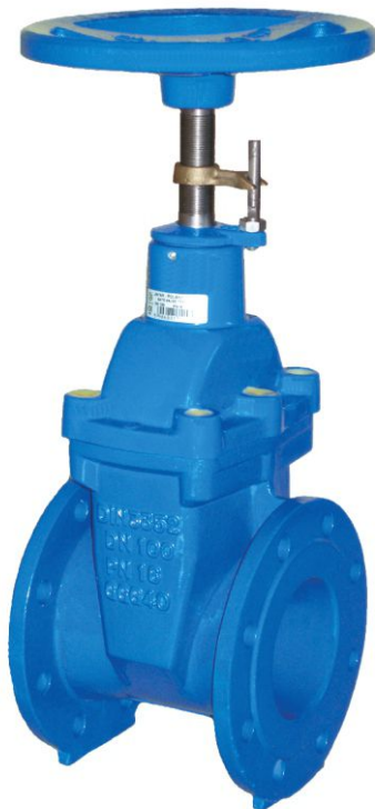
Na zdjęciu DN100

Задвижка с мягким уплотнением с указателем открытия