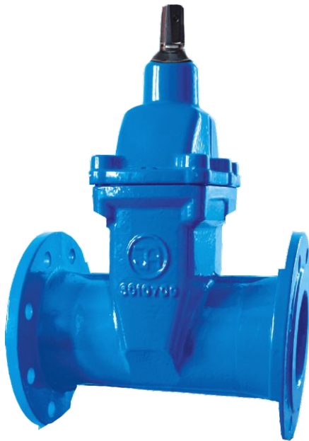
Na zdjęciu DN80