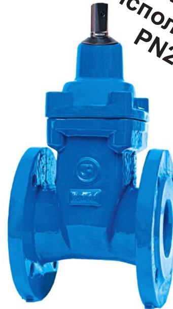
Na zdjęciu DN80